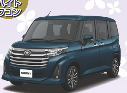
トヨタ ルーミー X 1,000cc 4WD CVT