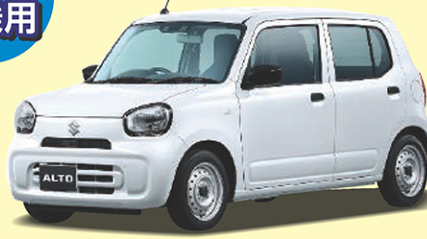
スズキ アルト A 660cc 4WD CVT