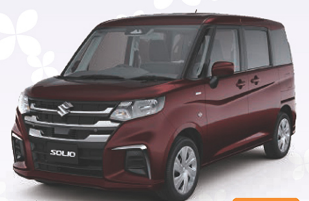
スズキ ソリオ HYBRID MG 1,200cc 4WD CVT