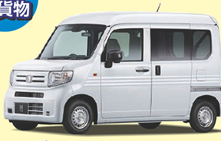
ホンダ N-VAN G 660cc 4WD CVT