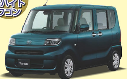
ダイハツ タント L 660cc 4WD CVT