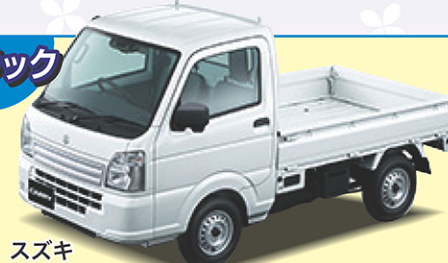
スズキ キャリートラック KC エアコン・パワステ 660cc 4WD 4AT